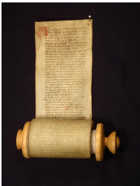
Fig. 1. Kjøbenhavns Guldsmedelaugs skrå fra 1429. Skråen blev skrevet på en 132 cm lang strimmel pergament syet sammen af to stykker. Artiklerne var ikke nummererede, men overgangen til ny artikel markeredes med rød farve (Københavns Stadsarkiv).

Skråen indeholdt 33 artikler, hvoraf 5 beskæftigede sig med laugsbrødrenes opførsel både i og uden for laugets, 12 med forholdet mellem laug, mestre, svende og lærlinge, 5 med de udførte arbejder, 2 med forholdet til kirken samt regler for begravelser, 5 med regler for laugets ledelse og 4 med uddannelsesforhold. Der var ingen krav til hverken svendeprøve eller udfærdigelse af mesterstykke, og skråen synes ikke at fastlægge nogen fast grænse mellem læredrenge og svende, ligesom den ikke gav regler for uddannelsens varighed. Både mestre og svende synes at have deltaget i laugets møder og stævner.